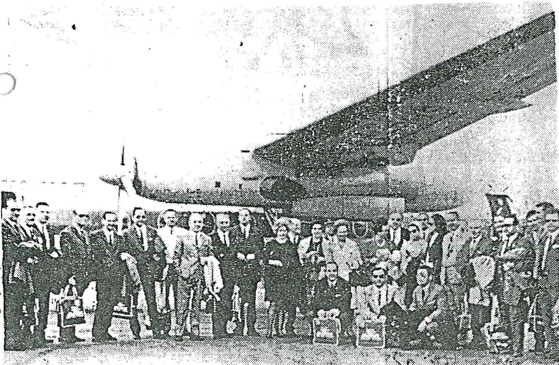
Autoridades de la provincia de Las Palmas e invitados que ayer marcharon a París en el vuelo inaugural de Iberia Canarias-Málaga-París.

PARIS, 16. — (Crónica de nuestro director PIO GOMEZ NISA, por telex).—Veinte grados a las tres y media de la tarde (hora local), al arribar al aeropuerto de Le Bourget; primavera calurosa en el barómetro y también en la calle: el Hotel Magestic —que es donde se ventilla la paz— está roteado de un verdadero parque automovilístico de la policía, y otro cerca del Hotel Hilton, que es donde nos alejamos nosotros, en previsión de nuevas manifestaciones estudiantiles.